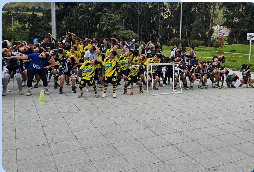
Juegos de la Amistad – Imagen de la jornada Usme, octubre de 2024