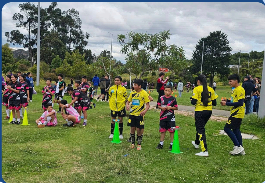
Juegos de la Amistad – Imagen de la jornada Usme, octubre de 2024