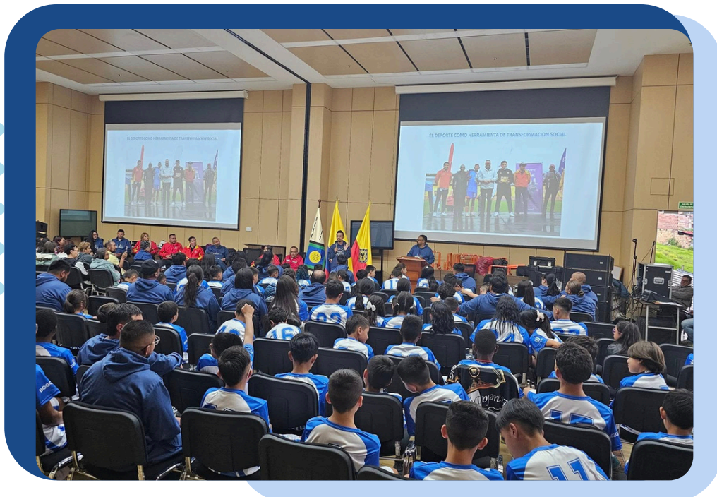
Animadores de Paz y Pacificadores en la clausura del Proyecto de Expansión de la Metodología P&S – Usme, junio de 2024