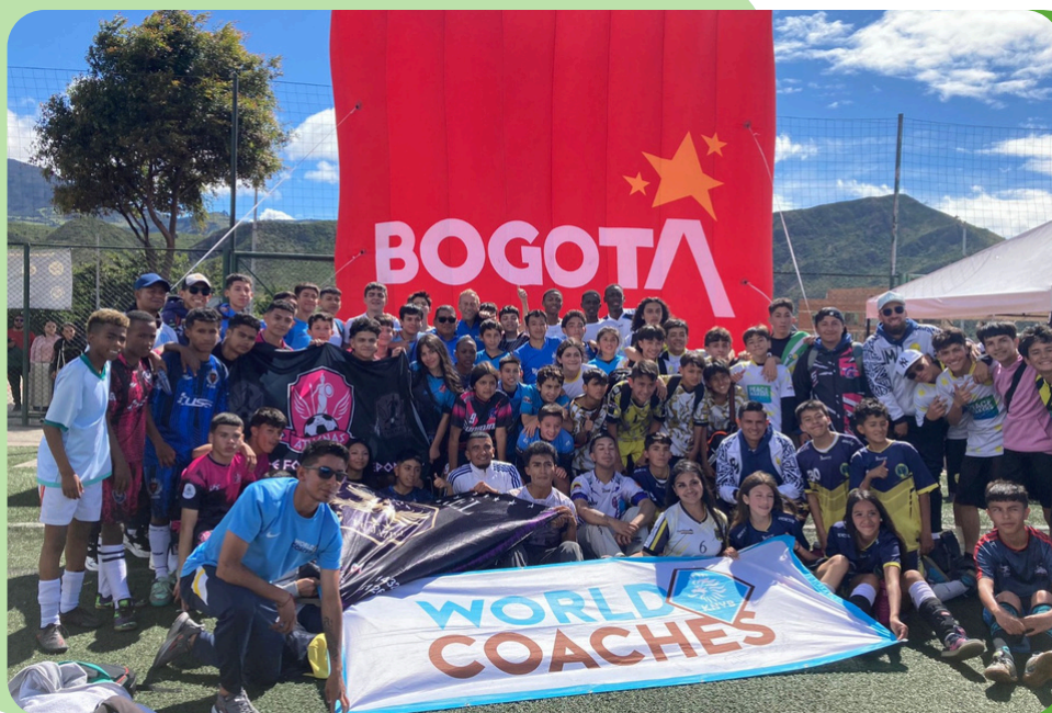
Taller práctico WorldCoaches – imagen de la jornada, julio 2024