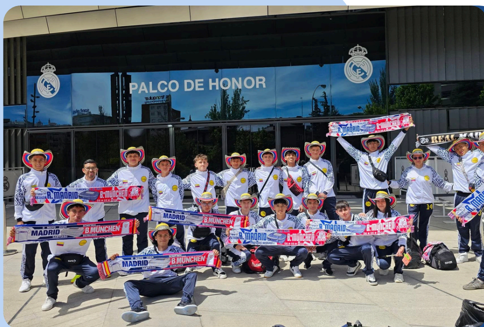
Frente a la tienda oficial del Real Madrid – Madrid, mayo de 2024