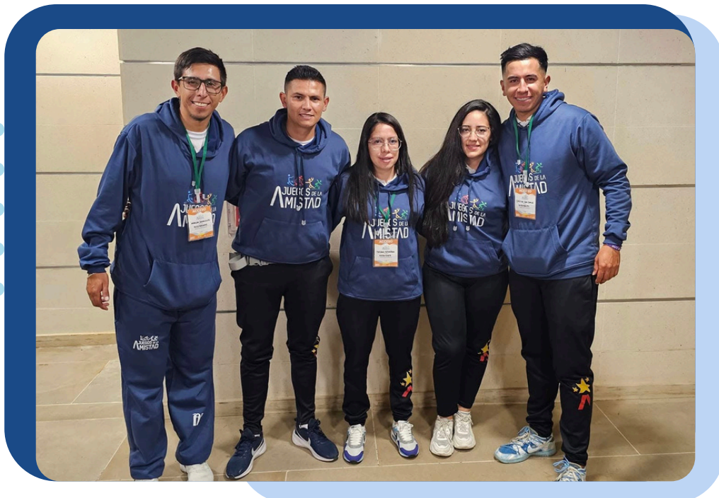
Equipo capacitador en la clausura del Proyecto de Expansión de la Metodología P&S – Usme, junio de 2024