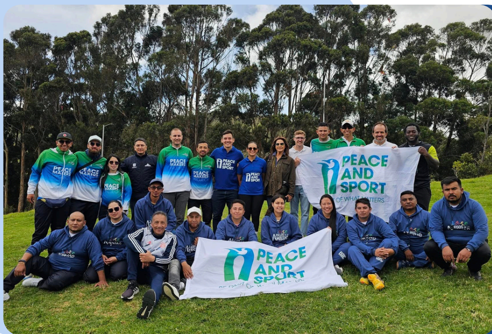
Juegos de la Amistad – Imagen de la jornada Usme, octubre de 2024