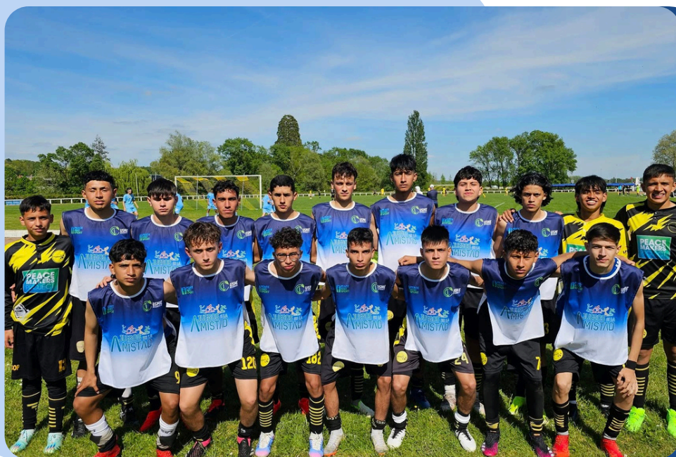
Fecha oficial de competencia, Torneo Internacional – Montichard, mayo 2024