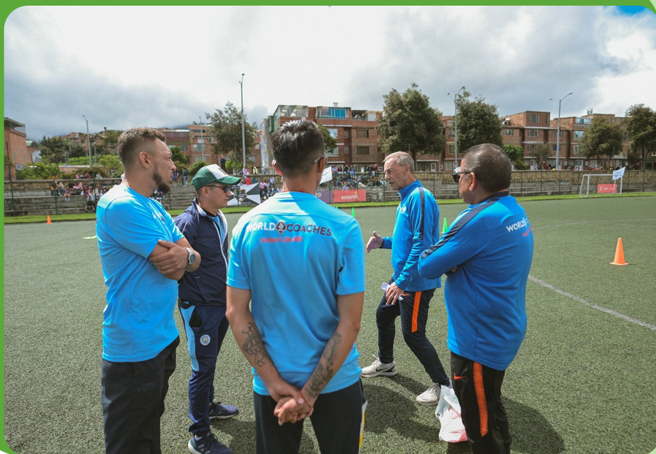
Taller práctico WorldCoaches – imagen de la jornada, julio 2024