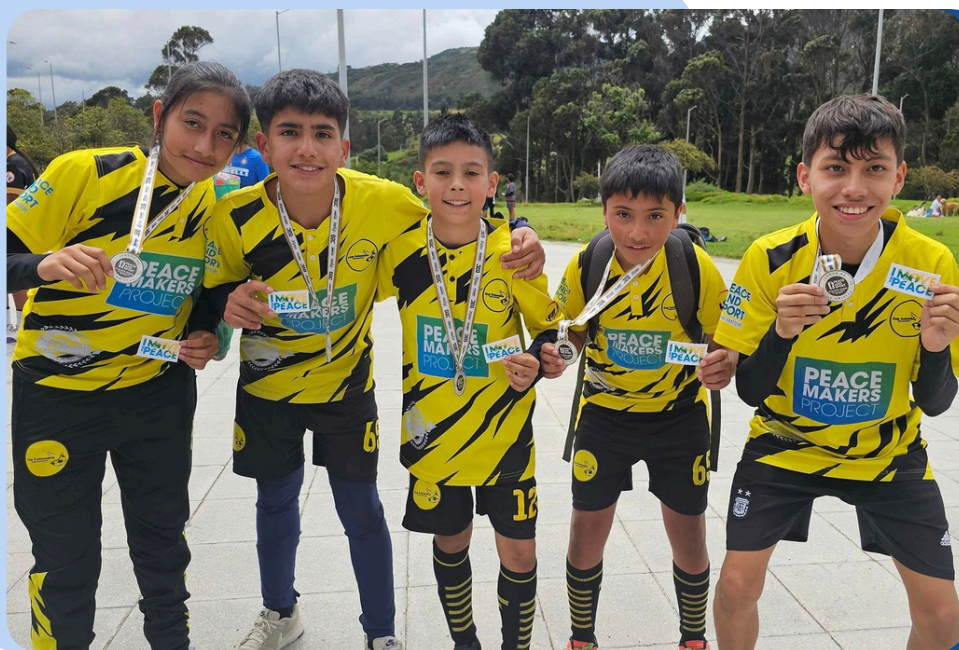
Juegos de la Amistad – Imagen de la jornada Usme, octubre de 2024