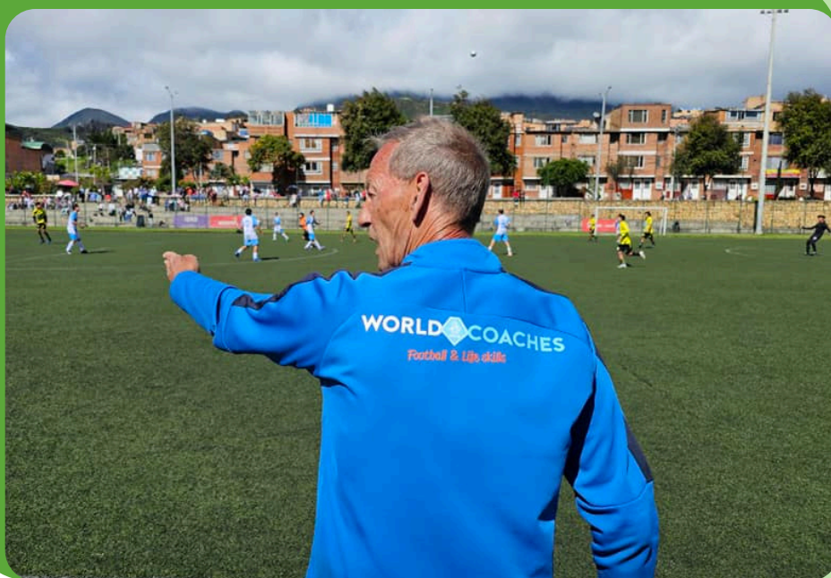
Partido de cierre del taller práctico WorldCoaches – imagen de la jornada, julio 2024