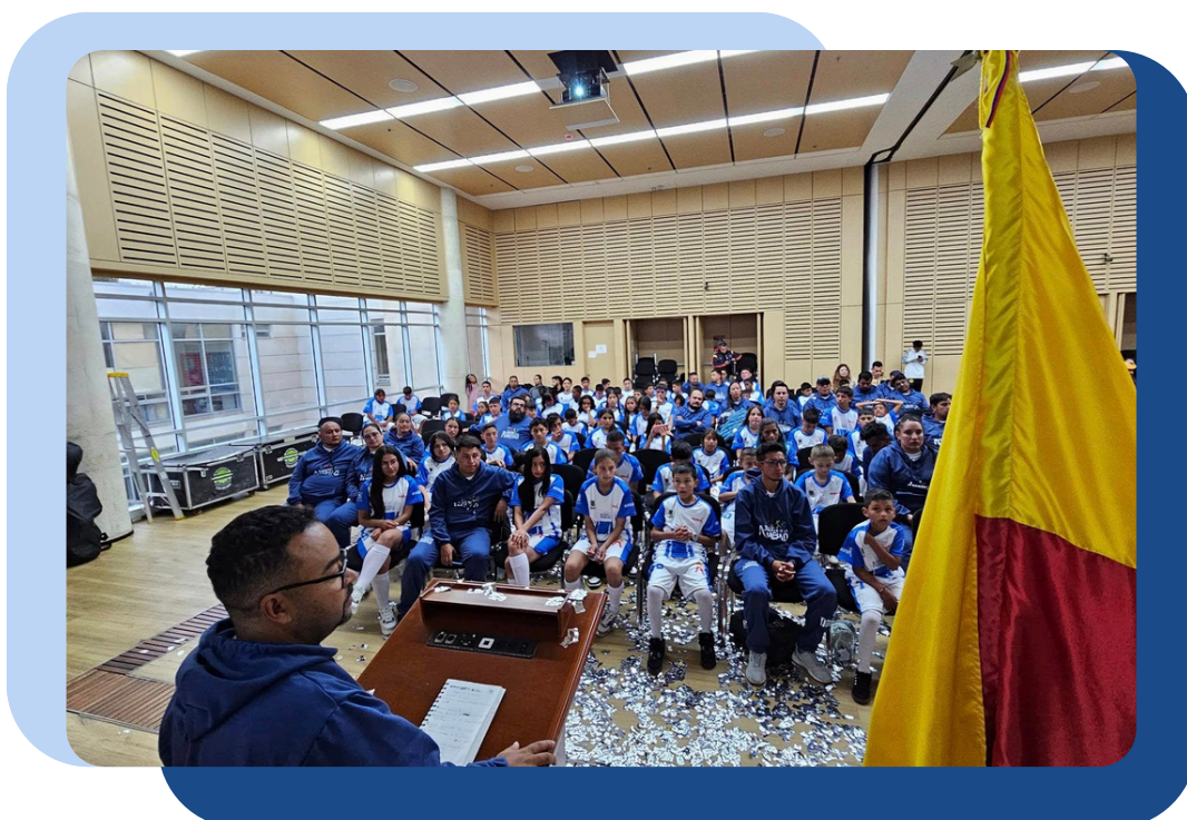
Animadores de Paz y Pacificadores en la clausura del Proyecto de Expansión de la Metodología P&S – Usme, junio de 2024