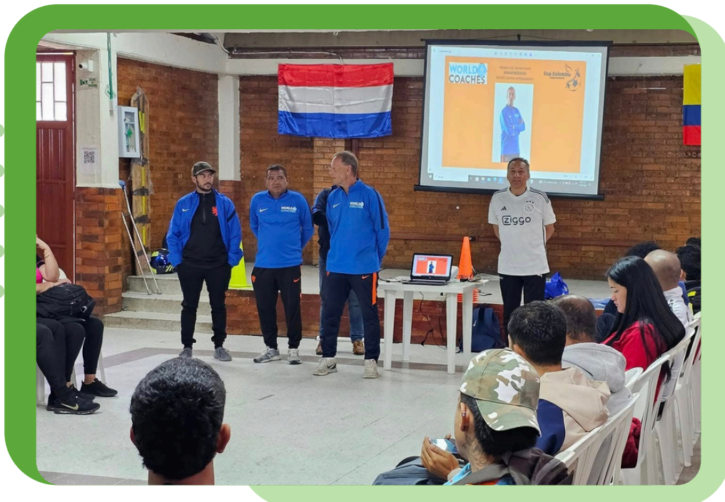
Taller teórico WorldCoaches – imagen de la jornada, julio 2024