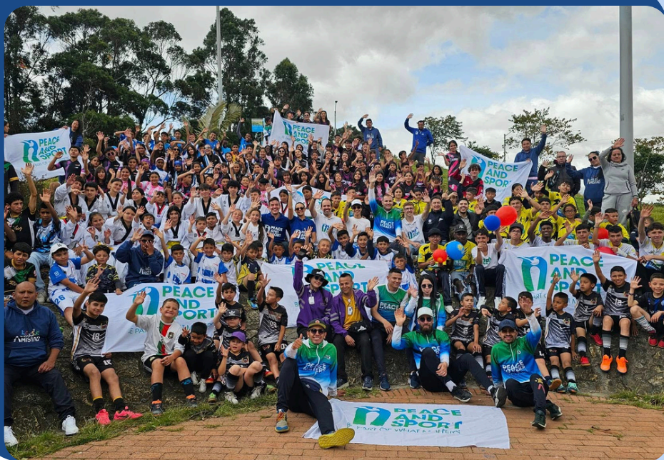
Juegos de la Amistad – Imagen de la jornada Usme, octubre de 2024