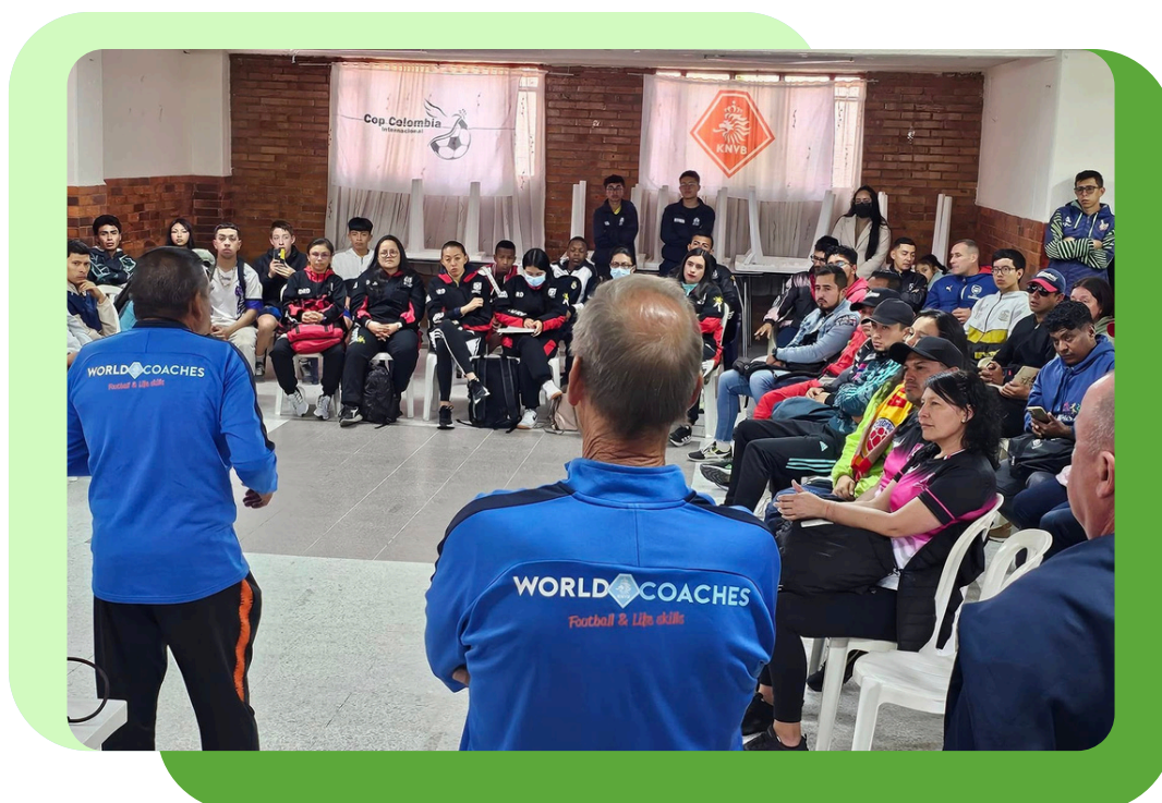
Taller teórico WorldCoaches – imagen de la jornada, julio 2024