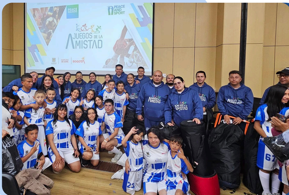
Animadores de Paz y Pacificadores en la clausura del Proyecto de Expansión de la Metodología P&S – Usme, junio de 2024