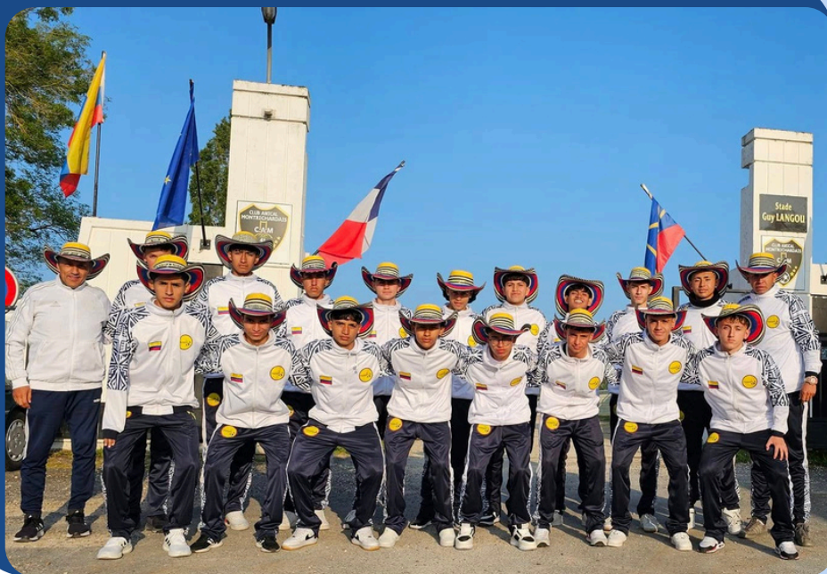
Sede del Club Avical Montrichardais, Montrichard – mayo de 2024