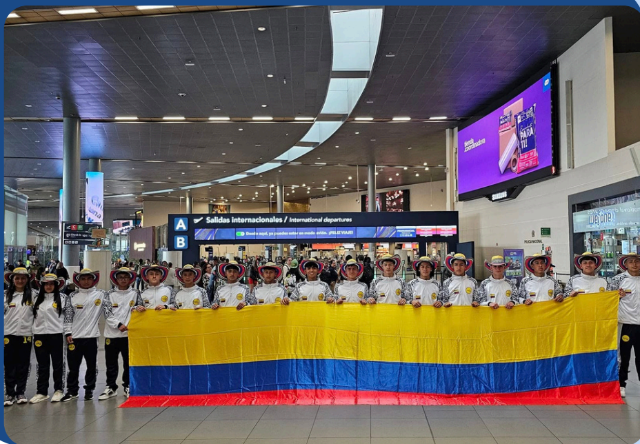
Momento previo al viaje, Aeropuerto El Dorado – Bogotá, mayo de 2024